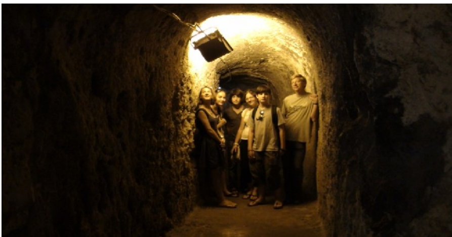
Wie man als Archäologe tief unter der Erde überlebt.