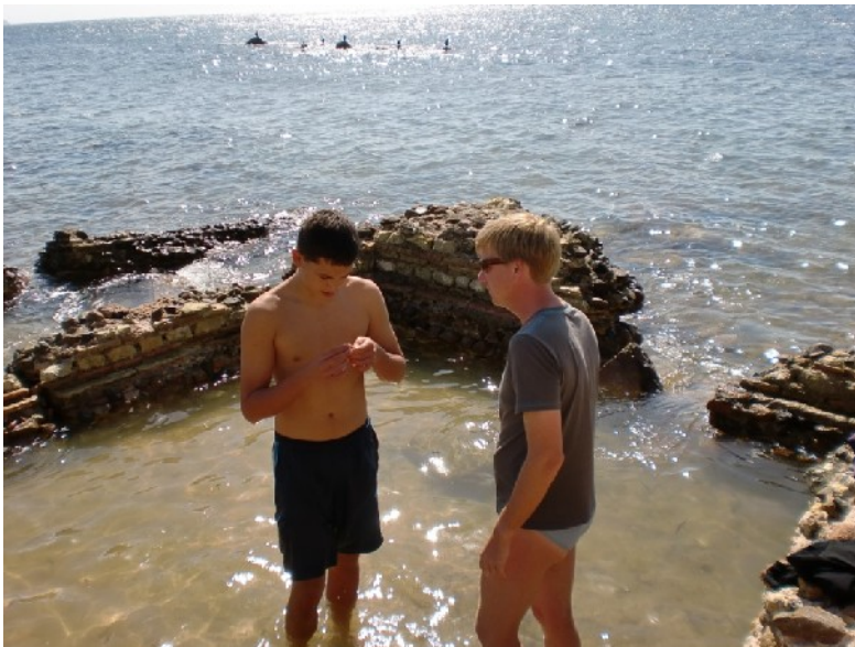
Wie man unter Wasser Sesterzien findet.